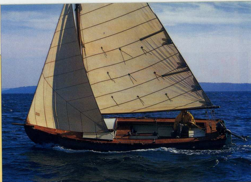
Vraiment étonnant ce Stir Ven : son look ne le laisse pas forcément supposer, mais cet engin à la fois très toilé et très léger marche comme un avion !

Ne pas se fier aux apparences, le Stir Ven trompe son monde. Derrière une élégante silhouette de vieux gréement se cache un vrai day-boat moderne, léger, performant et facile à manœuvrer. En bref ça a l'air bien, mais c'est encore beaucoup mieux que ça !